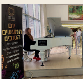
יום המעשים הטובים