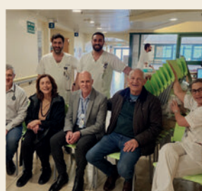
תרומת כסאות למחלקות פנימיות