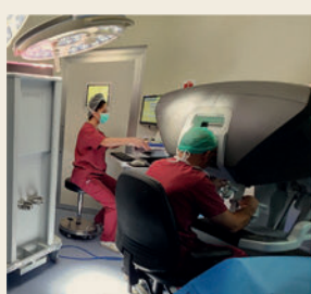
רכישת רובוט דה וינצ'י

מוזמנים להתרשם מפעילויות ויוזמות חדשות של העמותה: