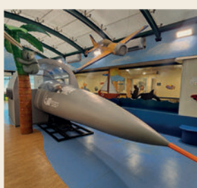
סימולטור טיסה במחלקת ילדים