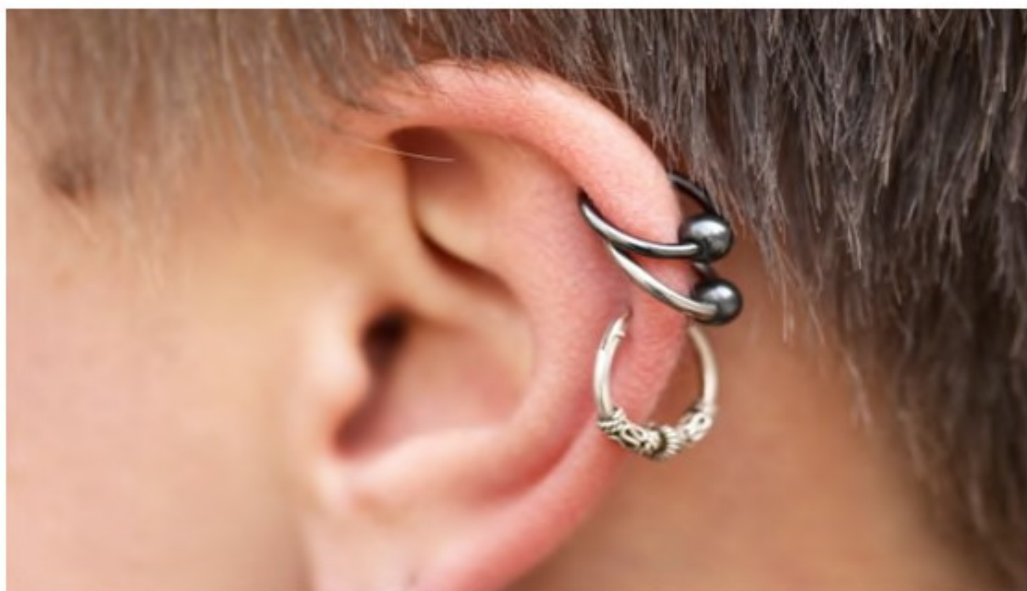
עלול לגרום לעיוות במראה האוזן // צילום: Gettyimages (אילוסטרציה)

פעולה פשוטה הפכה לאשפוז ממושך בבית החולים: ל', בת 34 מפרדס חנה-כרכור, בסך הכול רצתה פירסינג באוזן. מדובר בפעולה פשוטה לביצוע, אך החוויה הזו הפכה בין רגע לסיוט עבודה, ולאשפוז של שבועיים במחלקת אף-אוזן-גרון בבית החולים הלל יפה בחדרה. עקב זיהום חמור באוזן.